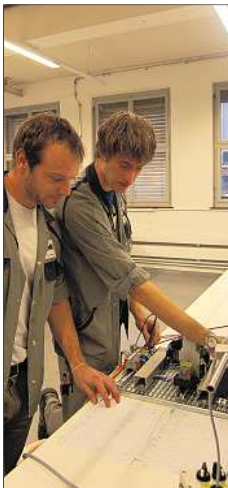
... überprüfen die Verdrahtung einer elektrischen Steuerung.

Im 3. und 4. Lehrjahr erfolgt die Schwerpunktausbildung in zwei Tätigkeitsgebieten des jeweiligen Lehrbetriebs. Diese Schwerpunktausbildungen werden bei der Lehrabschlussprüfung in Form einer individuellen Prüfungsarbeit vertieft und meist als pro-